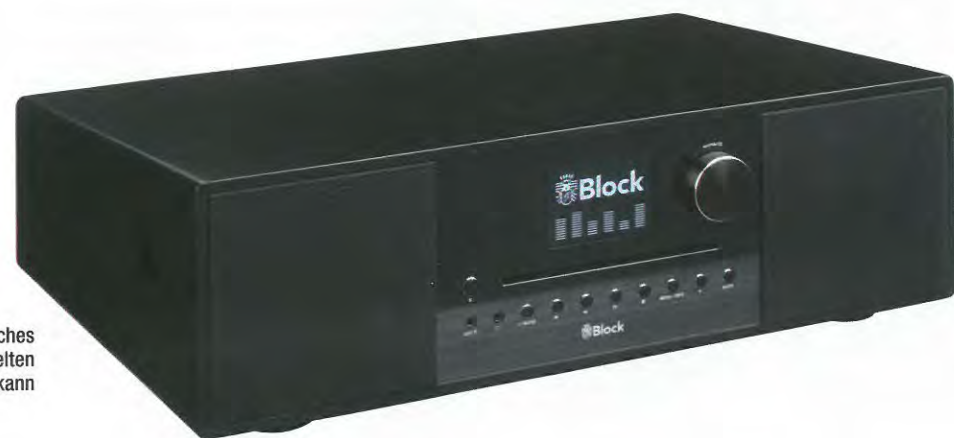
Elegantes Design und ein gut lesereiches Farbdisplay, welches auch Cover der gespielten Musik darstellen kann

Prima ist außerdem, dass das Audioblock-Musiksystem gleich einen Internetradio-Empfänger mit an Bord hat. Wem das noch nicht reicht, der kann Musikdaten per Bluetooth zu spielen oder den eingebauten Spotify-Connect-Zugang nutzen – für letzteren ist natürlich ein