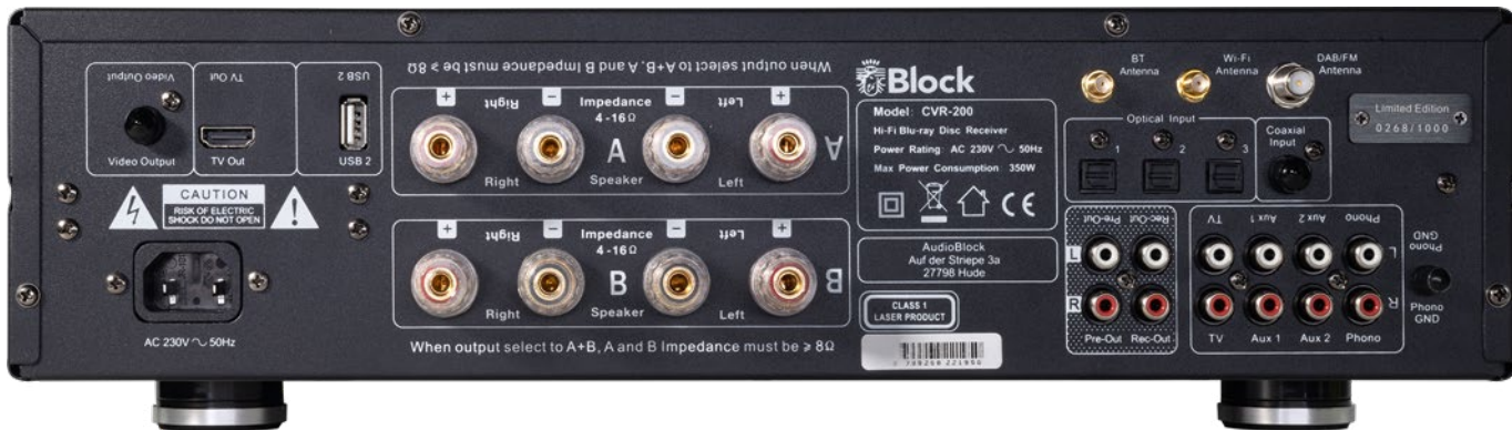
So viel Vielfalt und Möglichkeiten – der Block CVR-200 bietet Verbindungsmöglichkeiten für alle Eventualitäten

müssen wir die „Disc“-Taste ein zweites Mal drücken. Dann können wir die üblichen Blu-ray-Funktionen aufrufen – sie stehen über den Tasten. Zudem müssen wir beachten, dass die Wiedergabe der Blu-ray Disc nicht fortgesetzt wird, wenn wir die Quelle wechseln. Den Film einfach weiterschauen, falls wir zwischen durch Radio gehört haben, geht nicht. Wir müssen dann bis zur entsprechenden Stelle vorspulen, was auch passiert, wenn wir den Film zu lange pausieren. Hier könnte Audioblock noch ein wenig an der Software nachschrauben, was auch per Update auf das ja perfekt im Internet eingebundene Gerät möglich ist.