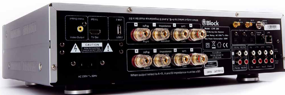
Sogar zwei Paar Vorverstärkeransgänge sind vorhanden

Bedienung Das im Gerät eingebaute, große Farbdisplay zeigt neben der gewählten Quelle und den umfangreichen Menü-Einstellungen auch die Cover der gerade gestreamten Musik an – auch die Logos von Internetradiostationen sowie die Namen der gerade gespielten Titel werden abgebildet. Wahlweise lässt sich der CVR-200 per Tasten am Gerät, per Fernbedienung oder per kostenloser Smartphone-App Undok bedienen. Apropos Fernbedienung: Der CVR-200 ist in der Lage, Infrarotbefehle von fremden Fernbedienungen zu erlernen. Man kann daher z.B auch die vorhandene TV-Fernbedienung nutzen und so die Anzahl der Infrarotgeber auf dem Wohnzimmer Tisch reduzieren.