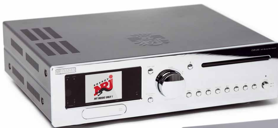
Limitierte Hochglanz-Sondereditionen in Chrom-Silber und Chrom-Schwarz