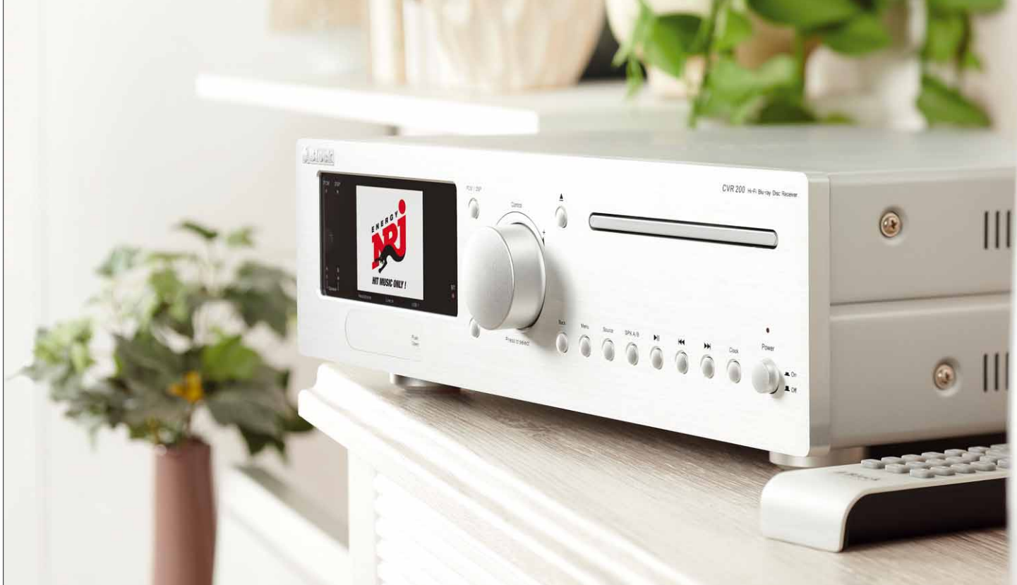
Das Laufwerk spielt neben CDs auch DVDs und Blu-ray-Discs ab

Zum schnellen Anschluss von Kopfhörer, USB-Stick oder einer analogen Quelle sitzen in der Front weitere Schnittstellen. Bei Nicht-Benutzung sind sie von einer magnetisch gehaltenen Klappe geschützt, welche selbstverständlich Ton in Ton zur restlichen Front verchromt ist.